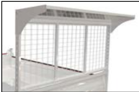
Casquette de protection cabine