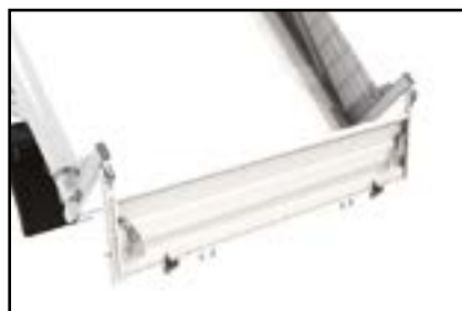
Porte à décrochage automatique