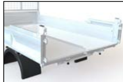
Porte à deux vantaux