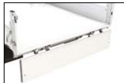
Porte à ouverture manuelle vers le bas