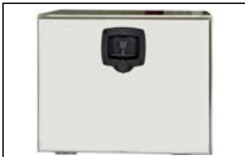
Coffre sous benne inox