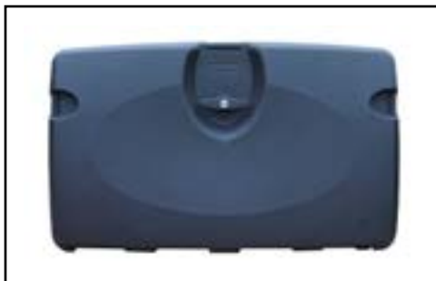
Coffre sous benne polyurethane