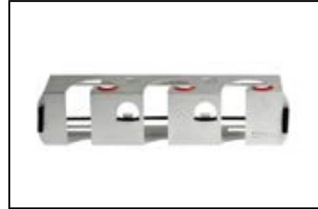
Porte-outils - Outils accessibles depuis le sol