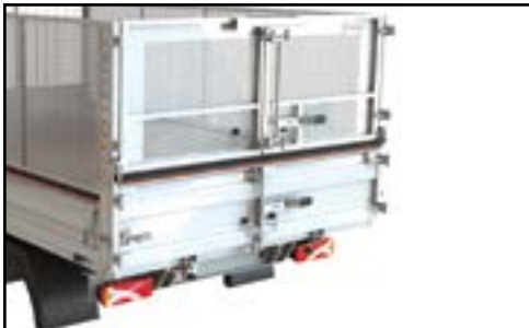
Réhausse arrière sans barre d'écartement