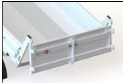
Porte à décrochage automatique