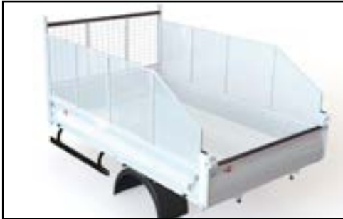
Réhausse latérale tôle perforée pan coupé