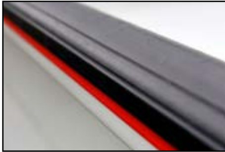
Protection des ridelles