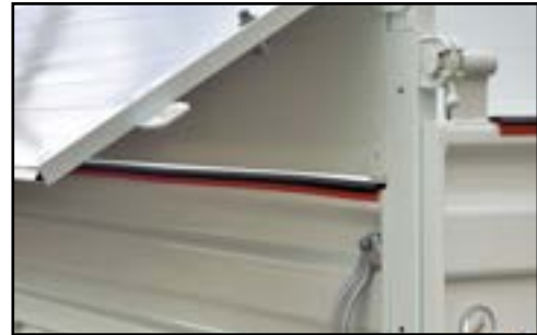
Réhausse articulées aluminium