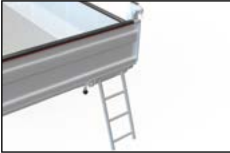
Echelle d'accès - Accéder à votre benne en toute sécurité