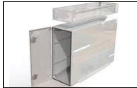
Coffre avec panier