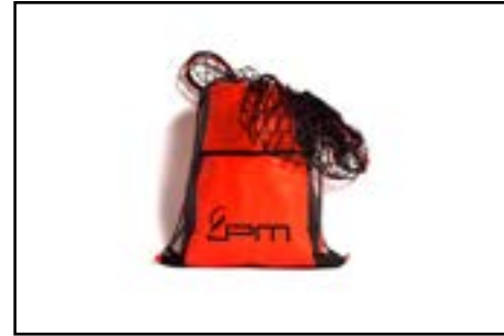
Filet - Chargement maintenu et sécurisé