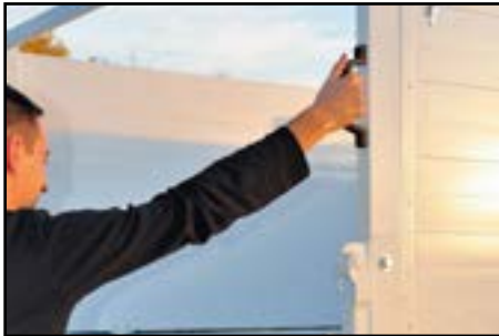
Poignée - Accès à la benne facilité